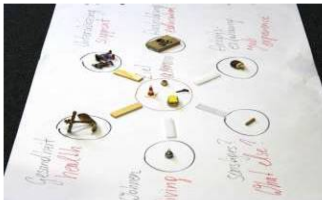
Фигура 4: Уреди за оценяване