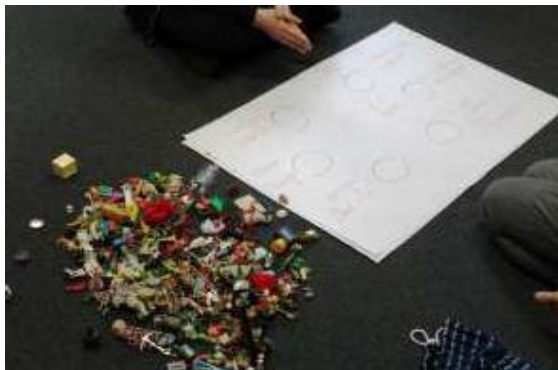
Фигура 2: Работна повърхност за Базово Изявяване

Работната повърхност има структурата на атом, като в центъра откриваме целта, а около нея са съответните аспекти от живота на младия човек.