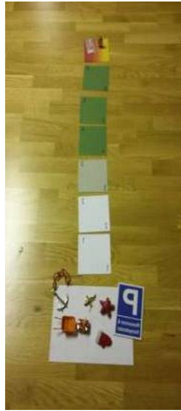
Плануване на пътека