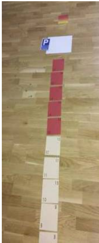
Фигура 6: Пътека на Ресурси/ Компетентност и

Участниците и треньорите трябва да работят на пода, ако е възможно.