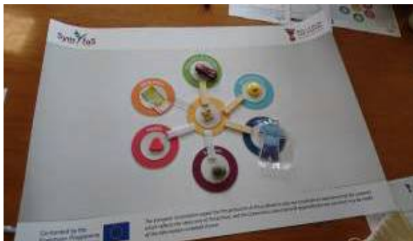
Фигура 1: Базово изясняване

Базовото изясняване на SymfoS е създадено, за да осигури на социалните работници бърз метод за преценяване на нуждите на младите хора, които срещат. Към края на преценяването социалните работници ще вземат решение, със съгласието на младия човек, също така ще определят какво е нивото на нужда на клиента и дали използването на символи може да се приложи в неговия случай.